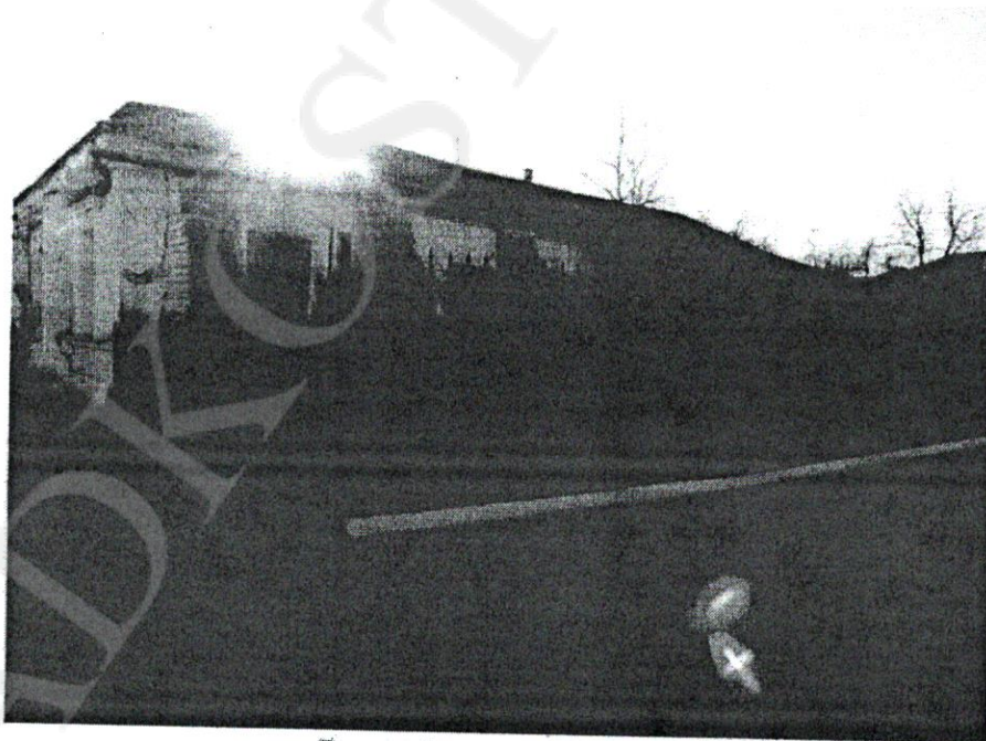
Дом жилой Акатова, 1-я пол. XIX в.» г. Кострома, ул. Комсомольская. 31 Боковой (северо-восточный) фасад