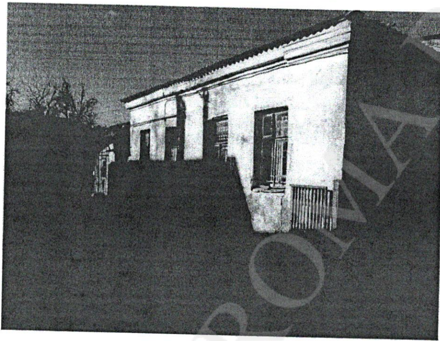
Дом жилой Акатова, 1-я пол. XIX в.» г. Кострома, ул. Комсомольская. 31 Боковой (юго-западный) фасад

Приложение к охранному обязательству собственника или иного законного владельца объекта культурного наследия, включенного в единый государственный реестр объектов культурного наследия (памятников истории и культуры) народов Российской Федерации